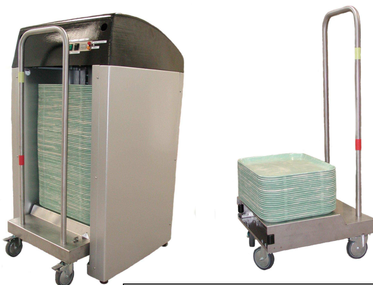
Chariot de conditionnement des plateaux, conçu pour s'intégrer dans le système de levage de la borne

Habillage optionnel ou adapté aux besoins du client ou de l'utilisateur final